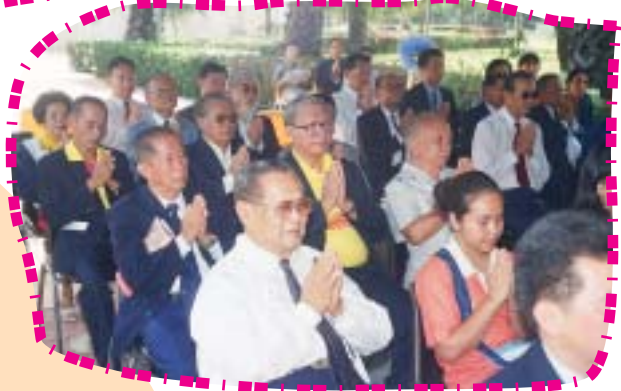
๑๐ พฤษภาคม ๒๕๔๔ พิธีเปิดอนุสาวรีย์ปรีดี พนมยงค์ ณ ศูนย์รังสิต