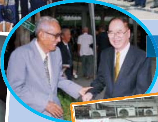
วันปรีดี