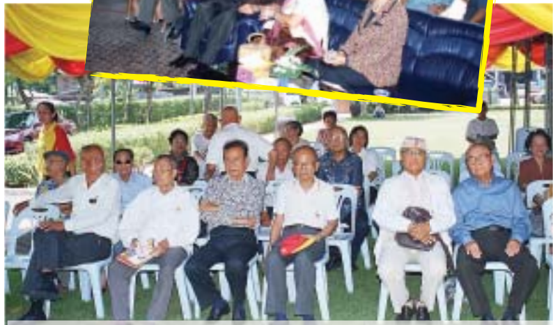
๒ พฤษภาคม ๒๕๕๗ พิธีทำบุญอุทิศส่วนกุศล จังหวัดพระนครศรีอยุธยา