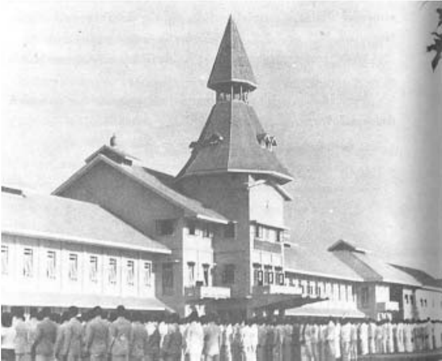
บันทึก ม.ธ.ก. รับปริญญา (๒๔๘๑)

ในปี ๒๔๘๑ นอกจากจะมีวิวัฒนาการที่สำคัญของ ม.ธ.ก. ในการเปิดการสอนเพื่อให้ประกาศนียบัตรทางการบัญชีแล้ว ยังมีการจัดตั้งโรงเรียนเตรียมปริญญามหาวิทยาลัยวิชาธรรมศาสตร์และการเมือง หรือที่รู้จักกันดีว่า ต.ม.ธ.ก. อีกด้วย ต.ม.ธ.ก. คือโรงเรียนและนักเรียนระดับมัธยมบริบูรณ์ (๒ ชั้นปี เตรียมปีที่ ๑ และเตรียมปีที่ ๒) ที่เป็นปรากฏการณ์สำคัญของ ม.ธ.ก. อยู่ ๘ ปี มีนักเรียน ๘ รุ่น ระหว่างปี ๒๔๘๑-๒๔๙๐ (ปี ๒๔๘๙ และ ๒๔๙๐ มิได้มีการรับนักเรียนเตรียมอีกต่อไป แต่ใน ม.ธ.ก.