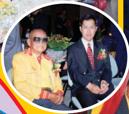
วันสถาปนามหาวิทยาลัยธรรมศาสตร์