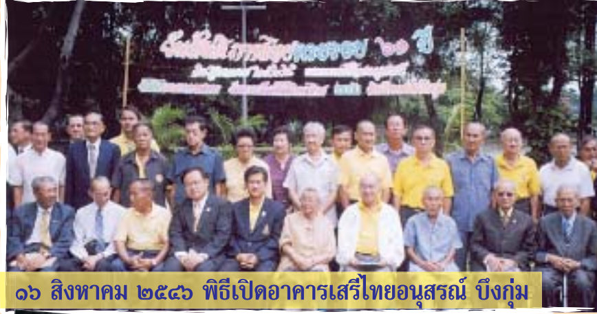
๑๖ สิงหาคม ๒๕๔๖ พิธีเปิดอาคารเสรีไทยอนุสรณ์ บึงกุ่ม