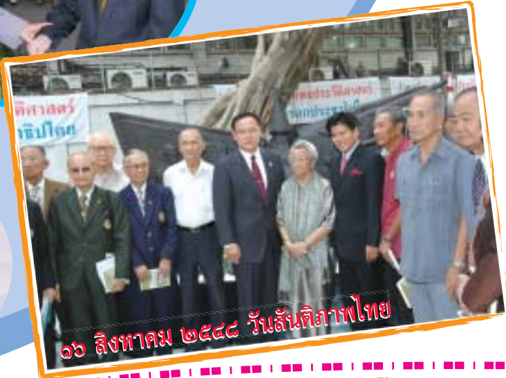
๑๖ สิงหาคม ๒๕๔๔ วันสันติภาพไทย