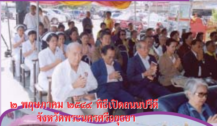
๒ พฤษภาคม ๒๕๕๙ พิธีเปิดถนนปรีดี จังหวัดพระนครศรีอยุธยา