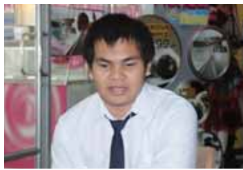
นักศึกษาพิการทางสายตา ศึกษาที่คณะวิทยาศาสตร์และเทคโนโลยี

มหาวิทยาลัยธรรมศาสตร์ เริ่มดำเนินโครงการและเปิดรับนักศึกษาผู้พิการมาตั้งแต่ปี ๒๕๔๖ โดยเปิดรับสมัครผู้พิการเข้าศึกษาปีละ ๕๗ คน ปัจจุบันมีนักศึกษาผู้พิการทั้งสิ้น ๖๓ คน จาก ๑๕ คณะ และในปีการศึกษา ๒๕๕๒ นี้ มีผู้พิการเข้ามาเป็นนักศึกษาใหม่ในรั้วแม่โดมอีกจำนวน ๒๒ คน โครงการดังกล่าว นับว่าเป็นโครงการที่มหาวิทยาลัยธรรมศาสตร์ เปิดโอกาสให้กับคนทุกประเภทในสังคมได้มีโอกาสเข้าศึกษาต่อในระดับปริญญาตรีอย่างครอบคลุมทุกสาขาโดยไม่มีข้อจำกัดทั้งสายทางด้านสังคมศาสตร์ สายทางวิทยาศาสตร์และเทคโนโลยี จึงเป็นครั้งแรกสำหรับผู้พิการทางสายตา ที่จะได้มีโอกาสเข้าศึกษาต่อในมหาวิทยาลัยธรรมศาสตร์ ซึ่งเป็นสถาบันแรกที่ให้ผู้พิการได้