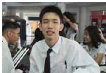
นักศึกษาวินิจฉัย ศึกษาที่คณะสังคมสงเคราะห์ศาสตร์

สามารถเข้าศึกษาต่อในสายวิทยาศาสตร์และเทคโนโลยีได้ ตลอดจนในปีการศึกษา ๒๕๕๒ นี้ มหาวิทยาลัยธรรมศาสตร์ ขยายโอกาสทางการศึกษาให้แก่ผู้พิการออทิสติกส์ สามารถเข้าเรียนในคณะสังคมสงเคราะห์ศาสตร์ เป็นแห่งแรกของประเทศด้วย