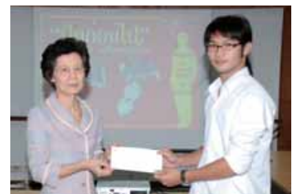
รางวัลชนะเลิศ