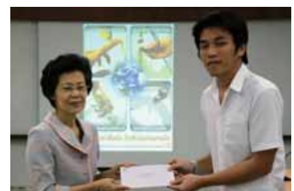
รางวัลชมเชย