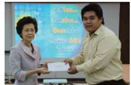
รางวัลชนะเลิศอันดับ ๒