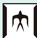
สำนักงานสถาบันเทคโนโลยี แห่งโตเกียวในประเทศไทย