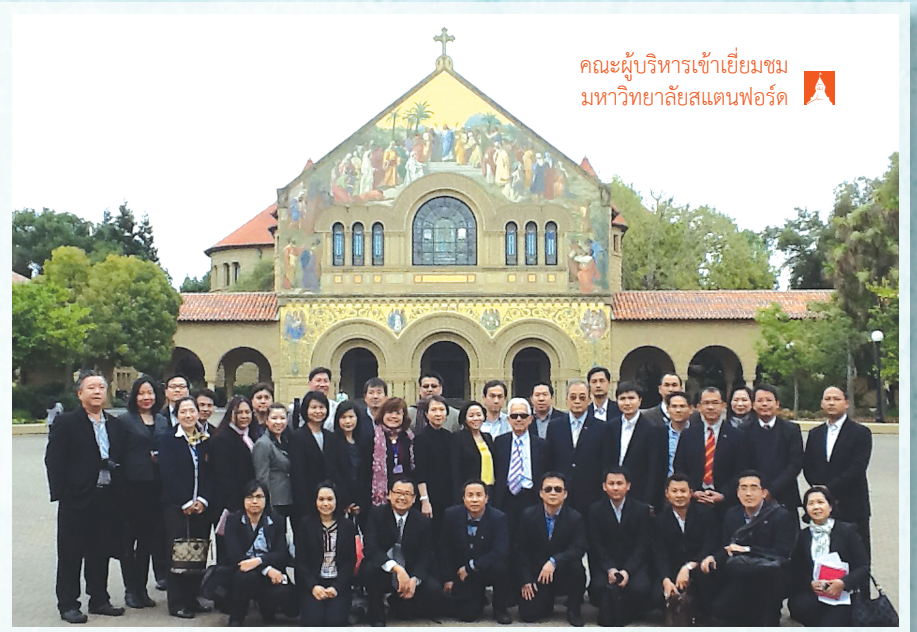
คณะผู้บริหารเข้าเยี่ยมชม มหาวิทยาลัยสแตนฟอร์ด

อย่างไรก็ตาม ปัจจัยที่ทำให้มหาวิทยาลัยทั้งสองแห่งอยู่ในระดับโลกได้นั้น มิใช่แค่เพียงเงินทุนที่มากเท่านั้น แต่ยังอยู่ที่มุมมองในการทำวิจัยที่โดดเด่น ปัญหาวิจัยที่มหาวิทยาลัยทั้งสองให้ความสนใจจะเป็นระดับโลกมีแนวคิดว่าจะต้อง “Think Big” โดยตั้งโจทย์วิจัยจากปัญหาที่เป็นสากลมากกว่าปัญหาระดับท้องถิ่น เป็นสหวิทยาการหรือ Multidisciplinary โดยเป็นการร่วมมือกันของนักวิจัยที่มาจากหลากหลายสาขานอกจากนี้ มหาวิทยาลัยทั้งสองแห่งยังให้ความสำคัญกับการเผยแพร่ผลงานออกสู่สังคม มีหลักสูตรที่สอนให้นักศึกษารู้จักคิดและพัฒนาผลงานวิจัยที่ได้ให้เป็นสินค้า เช่น College of Engineering ของมหาวิทยาลัยแคลิฟอร์เนียเบิร์กลีย์ มีหลักสูตร Entrepreneurship ส่วนที่มหาวิทยาลัยสแตนฟอร์ดมี “Stanford Technology Venture Program” สำหรับฝึกอบรมเชิงปฏิบัติให้กับนักศึกษา ผลงานที่สำคัญของโครงการนี้ที่เราจำกันได้คือ “Instagram” นั่นเอง