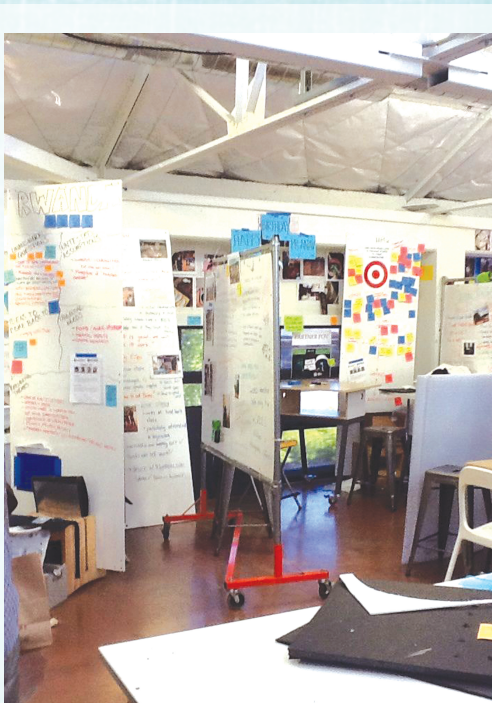
บรรยากาศภายใน D-School ที่ Stanford University