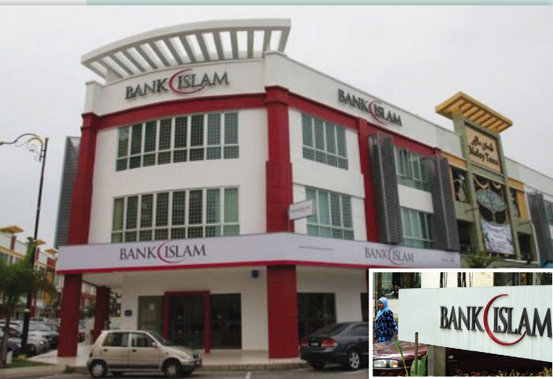
<< ระบบทางการเงินอิสลามของประเทศมาเลเซียถือว่ามีความก้าวหน้ากว่าประเทศมุสลิมอื่นๆ