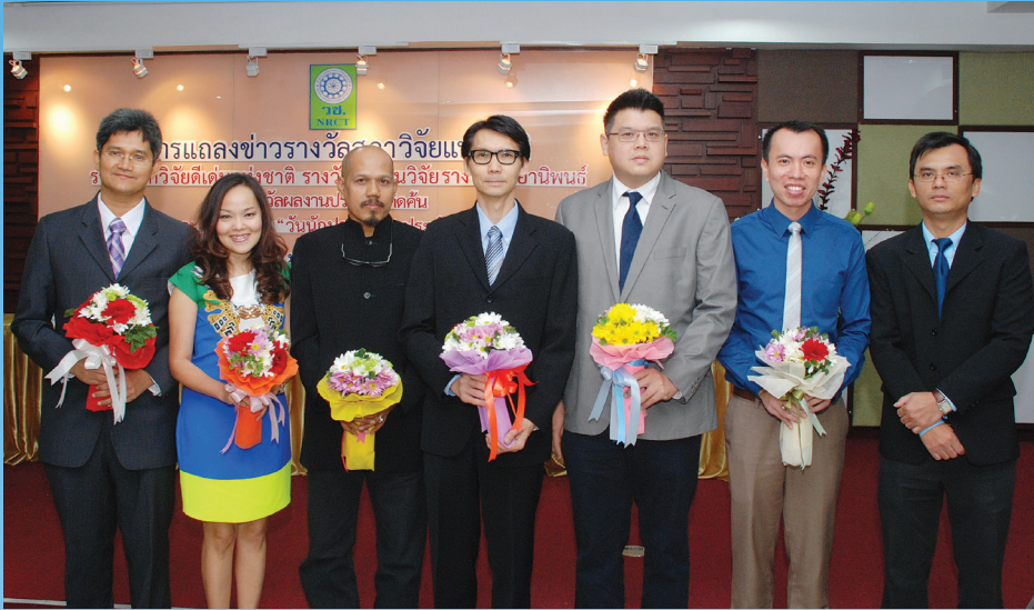
<< บรรยากาศในงานแถลงข่าว การประกาศรางวัลสภาวิจัย เมื่อวันที่ 9 มกราคม 2557 ณ สำนักงาน คณะกรรมการวิจัยแห่งชาติ (วช.)

คณาจารย์ มหาวิทยาลัยธรรมศาสตร์ ผลิตผลงานวิจัยคุณภาพ ตอกย้ำศักยภาพด้านการวิจัยของธรรมศาสตร์ กว่า 8 รางวัลจากสภาวิจัยแห่งชาติ แบ่งเป็นรางวัลนักวิจัยดีเด่นแห่งชาติ ประจำปี 2556 จำนวน 1 รางวัล ในสาขา วิศวกรรมศาสตร์และอุตสาหกรรมวิจัย รางวัลผลงานวิจัยแห่งชาติ ประจำปี 2556 จำนวน 3 รางวัล รางวัลวิทยานิพนธ์ จำนวน 2 รางวัล และรางวัลผลงานประดิษฐ์คิดค้น 2 รางวัล ซึ่งสำนักงานคณะกรรมการวิจัยแห่งชาติ (วช.) กำหนดจัดพิธีมอบรางวัลและจัดแสดงผลงานในงานวันนักประดิษฐ์ ประจำปี 2557 ภายใต้แนวคิด “Innovation for Mankind” ในวันที่ 2-5 กุมภาพันธ์ 2557 ณ ศูนย์การประชุมอิมแพค (ฮอลล์ 9) เมืองทองธานี