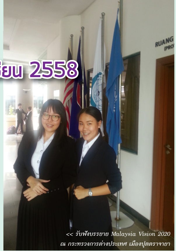
<< รับฟังบรรยาย Malaysia Vision 2020 ณ กระทรวงการต่างประเทศ เมืองปุตตราจายา

นอกจากนี้ มาเลเซียยังมีวิสัยทัศน์ที่กว้างไกล มองไปข้างหน้าไปถึงการพัฒนาประเทศให้กลายเป็นประเทศที่พัฒนาแล้วในปี 2563 ในนาม Malaysia Vision 2020 ทำให้มาเลเซียเร่งพัฒนาโครงสร้างพื้นฐานเพื่อรองรับการเจริญเติบโตของเศรษฐกิจในอนาคต การจัดวางผังเมืองที่เป็นระบบระเบียบประกอบกับระบบขนส่งสาธารณะที่มีประสิทธิภาพรวดเร็วและน่าเชื่อถือทำให้ช่วยลดการจราจรที่คับคั่งลงได้ อีกทั้งรูปแบบการขนส่งทางทะเลที่มีการจัดสรรพื้นที่เป็นเขตอุตสาหกรรมและการกระจายสินค้า โดยมีระบบเชื่อมต่อกับถนน ทางรถไฟ ท่าอากาศยาน และการขนส่งทางน้ำที่มีประสิทธิภาพ และมีที่ตั้งทางภูมิศาสตร์อยู่ในจุดชุมชุมของเส้นทางการเดินเรือหลัก ทำให้ทั้งท่าเรือตันจุงเปเลปัส (Port of Tanjung Pelepas) และท่าเรือกลัง (Port Klang) ซึ่งเป็นท่าเรือที่สำคัญของประเทศ มีปริมาณสินค้าผ่านเข้าออก เป็นอันดับต้นๆ ของภูมิภาค ส่งผลให้ระบบโลจิสติกส์และการขนส่งของประเทศมาเลเซียนั้นอยู่ในอันดับที่ 28 จาก 155 ประเทศทั่วโลกที่ได้รับการสำรวจ (World