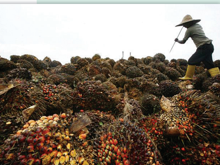
<< ผลผลิตทางการเกษตรโดยเฉพาะอย่างยิ่งปาล์มน้ำมัน ถือเป็นผลผลิตสำคัญของประเทศมาเลเซียในการส่งออกไปยังหลากหลายประเทศทั่วโลก ที่มา: http://www.thehindubusinessline.com

ที่มา: World Bank; 2012 data—Country statistics offices (Philippines, Singapore, and Vietnam); Media releases (Indonesia and Thailand); and author's estimates (Malaysia)