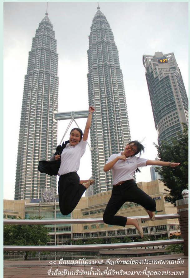
<< ตึกแฝดปิโตรนาส สัญลักษณ์ของประเทศมาเลเซีย ซึ่งถือเป็นบริษัทน้ำมันที่มีอิทธิพลมากที่สุดของประเทศ