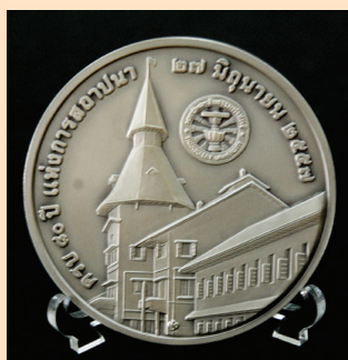
เหรียญที่ระลึก 3 บูรพาจารย์ เนื้อเงิน