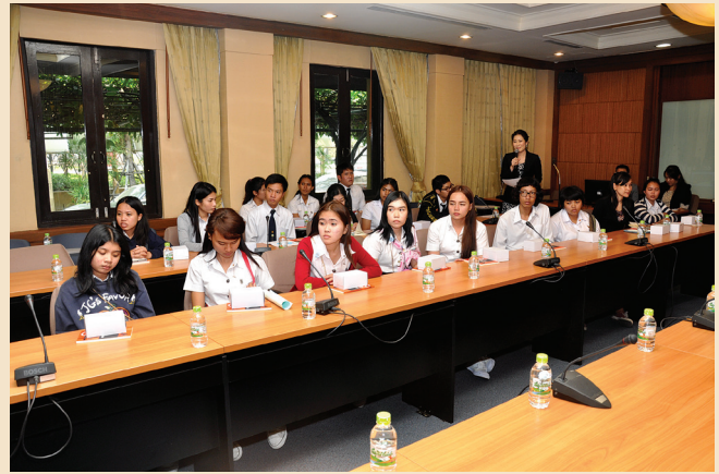
งานสถาปนาคณะสังคมสงเคราะห์ศาสตร์ มหาวิทยาลัยธรรมศาสตร์ ครบรอบ 60 ปี

และการประกันสังคมในสมัยนั้นปัจจุบัน คณะสังคมสงเคราะห์ศาสตร์ เปิดการเรียนการสอนในหลักสูตรทางด้านสังคมสงเคราะห์ศาสตร์ และการพัฒนาชุมชน ทั้งระดับปริญญาตรี ปริญญาโท และปริญญาเอก ณ มหาวิทยาลัยธรรมศาสตร์ ท่าพระจันทร์ ศูนย์รังสิต และศูนย์ลำปาง รวมจำนวน 10 หลักสูตร มีนักศึกษาทุกระดับทุกชั้นปี จำนวน 1,839 คน และในปีการศึกษา 2557 คณะสังคมสงเคราะห์ศาสตร์ ได้กำหนดเปิดหลักสูตรนานาชาติศิลปศาสตรบัณฑิตสาขาวิชานโยบายสังคมและการพัฒนา เพื่อเตรียมความพร้อมการเข้าสู่ประชาคมอาเซียนในปี 2558