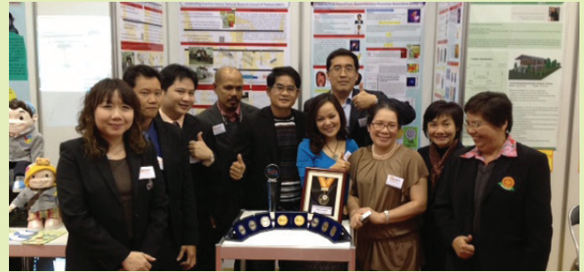
คณะนักวิจัย กว่า 10 รางวัล จากเวทีประกวดผลงานสิ่งประดิษฐ์โลก ประจำปี 2556 (41st International Exhibition of Inventions of Geneva) ณ กรุงเจนีวา สมาพันธรัฐสวิส

3) ให้ทุนสนับสนุนการตีพิมพ์ผลงานทางวิชาการสูงสุด ฉบับละ 50,000 บาท เชิดชูและให้รางวัลผลงานวิจัยดีเด่น รวมทั้ง รางวัลสิ่งประดิษฐ์ โดยในแต่ละปีจะมีการให้ทุนสนับสนุนการ เผยแพร่ผลงานวิจัยและสิ่งประดิษฐ์ มากกว่า 700 ทุน เชิดชูและให้ รางวัลผู้มีผลงานวิจัยดีเด่นและสิ่งประดิษฐ์ทั้งระดับคณะและ