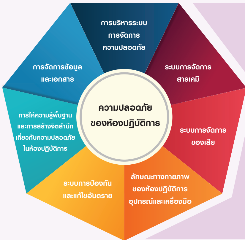
องค์ประกอบของห้องปฏิบัติการปลอดภัย

สารเคมี มหาวิทยาลัยธรรมศาสตร์ได้เข้าร่วมโครงการปี 2558 โดยมีห้องปฏิบัติการเข้าร่วมจำนวน 37 ห้องปฏิบัติการ จาก 7 คณะ โดยห้องปฏิบัติการจำนวน 3 ห้อง จากคณะแพทยศาสตร์ คณะสหเวชศาสตร์ และคณะทันตแพทยศาสตร์ ได้รับการยกย่องให้เป็นห้องปฏิบัติการต้นแบบที่มีแนวปฏิบัติที่ดีสอดคล้องกับการดำเนินการตาม มอก. 2677 ข้อกำหนดของระบบการจัดการด้านความปลอดภัยของห้องปฏิบัติการ จะมีการแบ่งการบริหารตามลักษณะกิจกรรมและความรู้ที่ใช้เป็น 7 องค์ประกอบ ดังปรากฏในภาพด้านล่าง