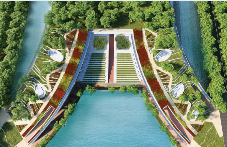
อุทยานเรียนรู้ป๋วย 100 ปี

ส่วนการส่งเสริมการเรียนรู้ธรรมชาติ จะเป็นการปลูกจิตสำนึก และความตระหนักถึงคุณค่าของพื้นที่สีเขียวแก่ประชาคม เพื่อให้ทุกคนร่วมแรงร่วมใจในการปกป้องรักษาพื้นที่สีเขียวไว้ ผ่านทางกิจกรรมทั้งในห้องเรียนและกิจกรรมนอกห้องเรียน ตัวอย่างเช่น การปลูkdต้นไม้อินตำนานทางพระพุทธศาสนา ในบริเวณพื้นที่รอบหอพระ เช่น ต้นสาละ ต้นมุจลินท์หรือต้นจิก และ ต้นราชายตนะ หรือต้นไม้เกด เป็นต้น โครงการสวนพฤกษศาสตร์สมุนไพรรวมพื้นที่ที่รวบรวมสมุนไพรมากกว่า 20 กลุ่ม ที่เปิดให้บุคคลทั่วไปเข้ามาหาความรู้ เป็นโครงการเพื่อการเรียนการสอนและการวิจัย โครงการดังกล่าวยังมีแนวทางเดินศึกษาธรรมชาติเป็นเส้นทางหลักความยาวมากกว่า 400 เมตร