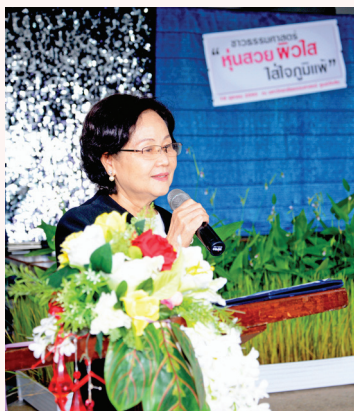
รองศาสตราจารย์กศิป์ วิศวกรรม