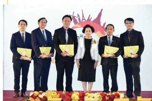
ผู้ที่มีผลงานวิจัยตีพิมพ์ที่ปรากฏในฐานข้อมูลสากล ISI, SCOPUS รวมจำนวนบทความมากที่สุด (ผลงานตั้งแต่ปี พ.ศ. 2559-2560) และผู้ที่มีผลงานวิจัยที่ถูกอ้างอิงในฐานข้อมูลสากล ISI, SCOPUS รวมจำนวนครั้งสูงที่สุดในฐานข้อมูล ISI, SCOPUS รวมจำนวนครั้งสูงที่สุด (ผลงานที่ถูกอ้างอิงในปี พ.ศ. 2556-2560)