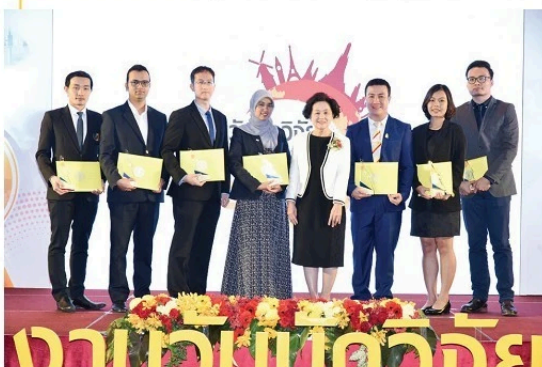
ผู้ได้รับรางวัลนักวิจัยรุ่นใหม่ดีเด่นระดับคณะ

ผู้ได้รับทุนวิจัยโครงการขนาดใหญ่ จำนวน 32 ท่าน ผู้ได้รับรางวัลประกาศเกียรติคุณด้านการวิจัยจากหน่วยงานภายนอก จำนวน 80 ท่าน ผู้มีผลงานจดสิทธิบัตรหรืออนุสิทธิบัตร จำนวน 13 ท่าน ผู้ได้รับรางวัลนักวิจัยรุ่นใหม่ดีเด่นระดับคณะ จำนวน 14 ท่าน