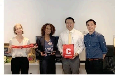
ธรรมศาสตร์ ต้อนรับ CORNELL UNIVERSITY สหรัฐอเมริกา หารือเกี่ยวกับ JOINT SYMPOSIUM และอื่นๆ